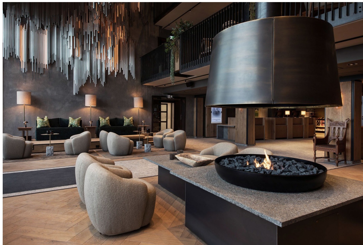
Scandic Holmenkollen Park Metropolis arkitektur og design AS