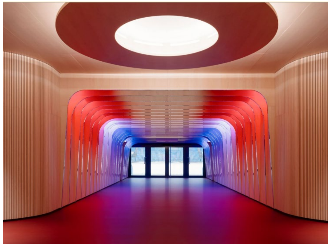
Ullevål stadion Snøhetta