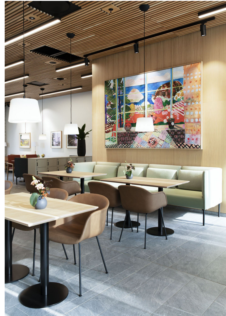
Carpe Diem demenslandsby Cadi AS