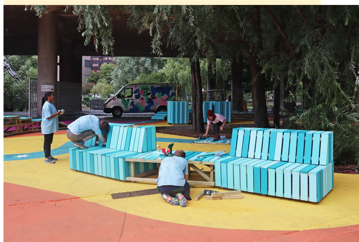
Områdeløft - Olafiagangen MakersHub Arkitektur AS

Risiko og kompleksitet bør fortsatt være førende for de kravene som stilles til foretakenes kvalifikasjoner